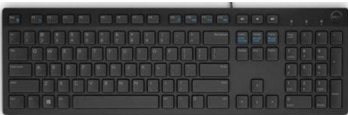
Teclado Multimídia da Dell - KB216