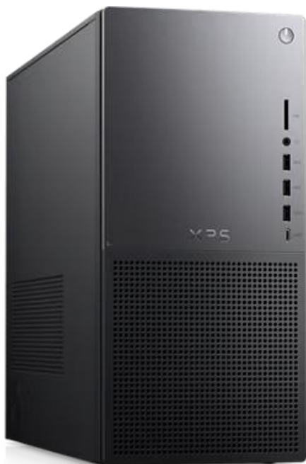
Novo DELL XPS

Processador: O desktop Dell XPS 8960 é equipado com tela Intel Core de última geração, proporcionando alto desempenho com múltiplos núcleos e threads para tarefas exigentes. O modelo específico pode variar, mas pode incluir inclusive o Intel Core i7-13700, que possui 16 núcleos, 24 MB de cache e velocidade de até 5,1 GHz.