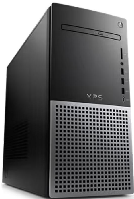
Dell XPS 8950

Processador: O desktop Dell XPS 8950 é equipado com um processador Intel Core i7 de última geração, proporcionando alto desempenho com múltiplos núcleos e threads para tarefas exigentes. O modelo específico pode variar, mas pode incluir como o Intel Core i7-12700, que possui 12 núcleos, 20 threads, cache de 25 MB e velocidade de até 4,90 GHz.