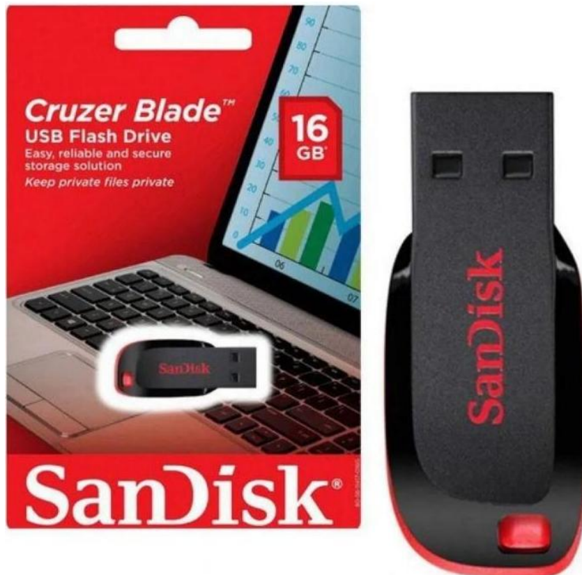
Pendrive 16GB Sandisk Cruiser Blade