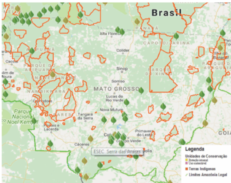
Mapa 2 – Localização Das Terras Indígenas e Unidades de Conservação de Mato Grosso