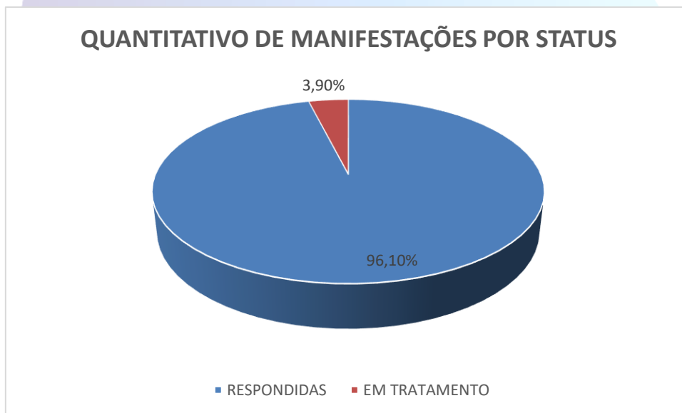
GRÁFICO 2 – QUANTITATIVO DE MANIFESTAÇÕES POR STATUS