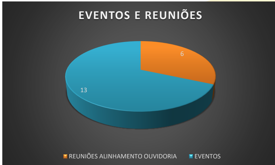
GRÁFICO 3 – EVENTOS E REUNIÕES PARTICIPADAS PELA OUVIDORIA DA AGER/MT