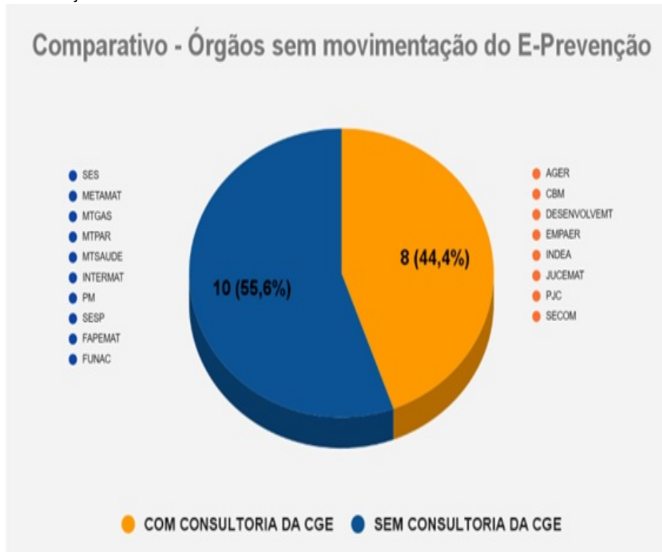
Gráfico 3 - Comparativo de consultorias realizadas em relação aos órgãos sem movimentação do e-Prevenção